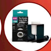
Ceramic Lamp Holder Plus Bracket Pro