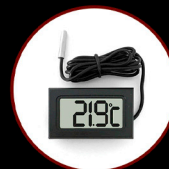
Digital Compact Thermometer