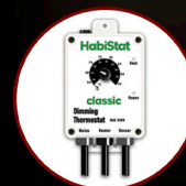
Dimming Thermostat 600W