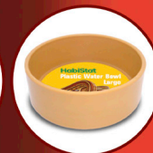
Round Plastic Water Bowl