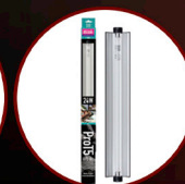
Pro T5 UVB Kit 6% UVB, 24W