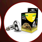
Basking Spotlamp 100W