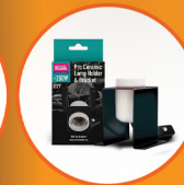
Pro Ceramic Lampholder and Bracket