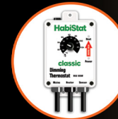
Dimming Thermostat, High Range, 600W