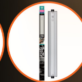
Pro T5 UVB Kit, Desert, 12% UVB, 39W