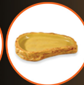
Sandstone Feeding Dish