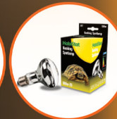
Basking Spotlamp 100W