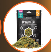
Earth Pro Dragon Fuel