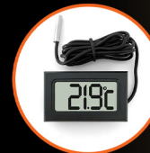
Digital Compact Thermometers x 2