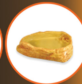
Sandstone Water Dish