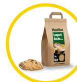
Leopard Gecko Bedding 5 kg