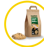
Leopard Gecko Bedding 5 kg