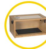
Terrainium 61 x 38 x 30cm (24 x 15 x 12")