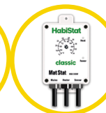
Mat Stat 300 Watt