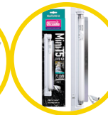
Mini UVB Kit, 7%UVB ShadeDweller Lamp, 8W