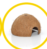
Coconut Cave x 2