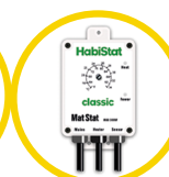
Mat Stat 300 Watt