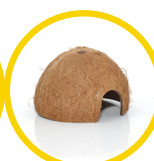
Coconut Cave x 2