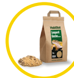
Leopard Gecko Bedding 5 kg