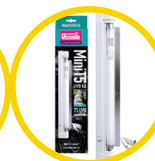
Mini UVB Kit, 7%UVB ShadeDweller Lamp, 8W