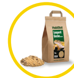
Leopard Gecko Bedding 5 kg